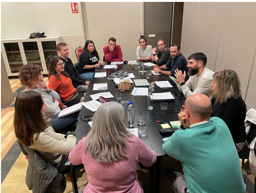
Trobada de l'equip de direcció/coordinació al Bar Cafè Nou de Mataró

Definides les 43 accions del Pla Estratègic 2024-2030 el novembre del 2023, l'equip de direcció i coordinació de l'escola, es reuneix en una jornada intensiva per definir les 15 propostes prioritàries que centraran l'activitat de l'escola fins el 2030.